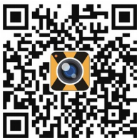
iOS App QR Code