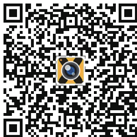
Android App QR Code

Instalace aplikace: je vyžadován OS Android 4,1 nebo IOS7 minimálně. Naskenujte kód níže a následujte instrukce pro instalaci.